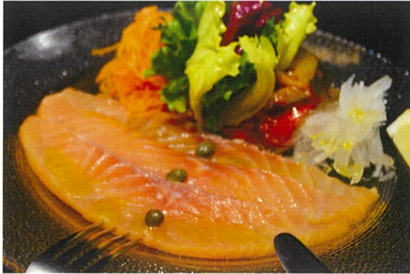
Smoked Salmon w/ salad