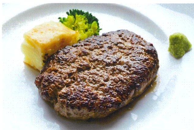
Wagyu Beef "Hamburg Steak"