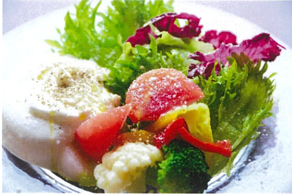
Shunkoutei Caesar Salad