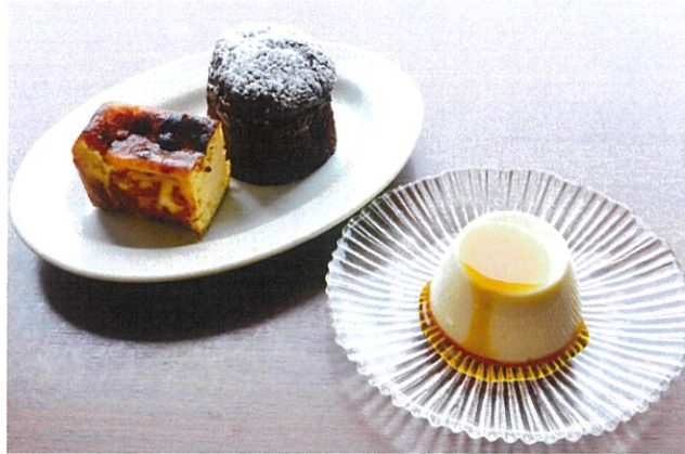
Assortment of 3 types of Desserts

デザート 3種盛り合わせ 1455 (1600 税込) Assortment of 3 types of Desserts