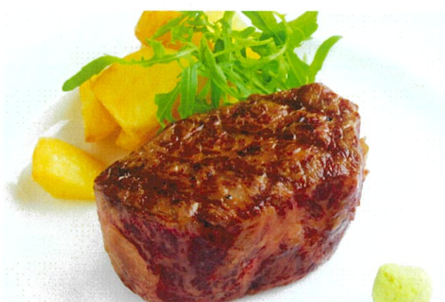
Wagyu Tender Loin Steak