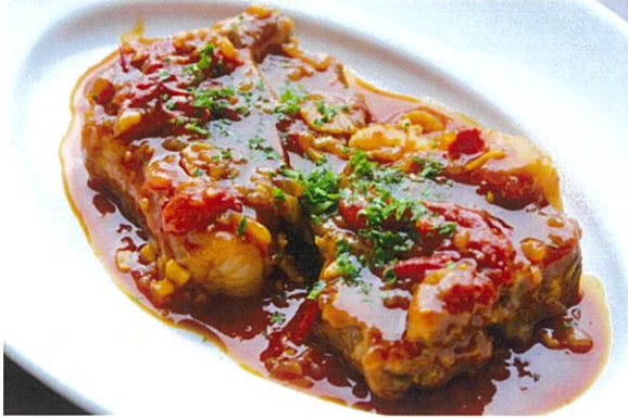
“Lamb” T-bone Stew