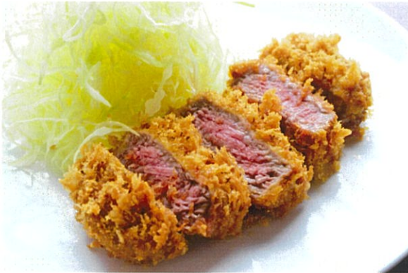
Crispy Fried Beef Sirloin

ビーフカツレツ Crispy Fried Beef Sirloin 2182 (2400 税込)