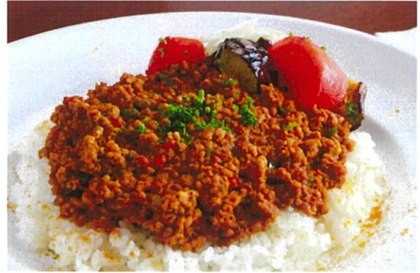
Keema Curry & Rice