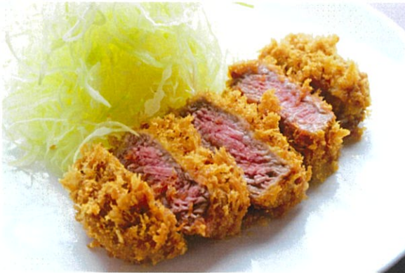
Crispy Fried Beef Sirloin