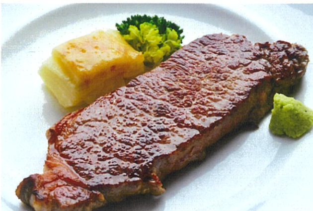
Beef Sirloin Steak